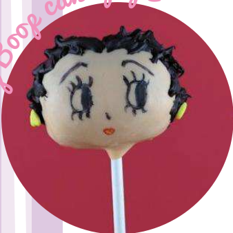
Betty Boop cake pops