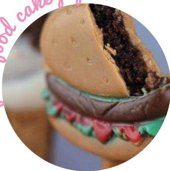
Junk food cake pops !