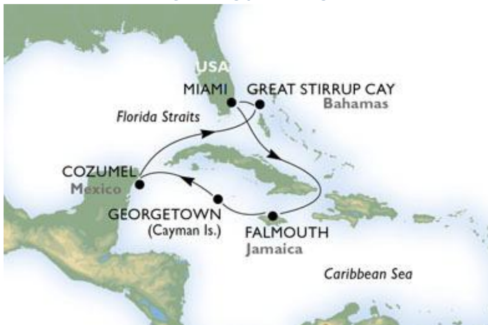
Croisière: Etats-Unis, Jamaïque, Iles Cayman, Mexique, Bahamas