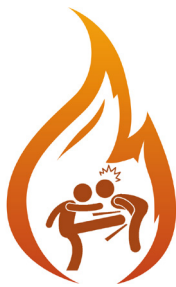
Boxe de Rue

Adrenalib est la référence de la self-défense en ligne. Apprenez à vous défendre, quelle que soit la situation. Découvrez les formations de nos experts et pratiquez nos techniques. Améliorez votre préparation physique, musculaire et cardio-vasculaire.