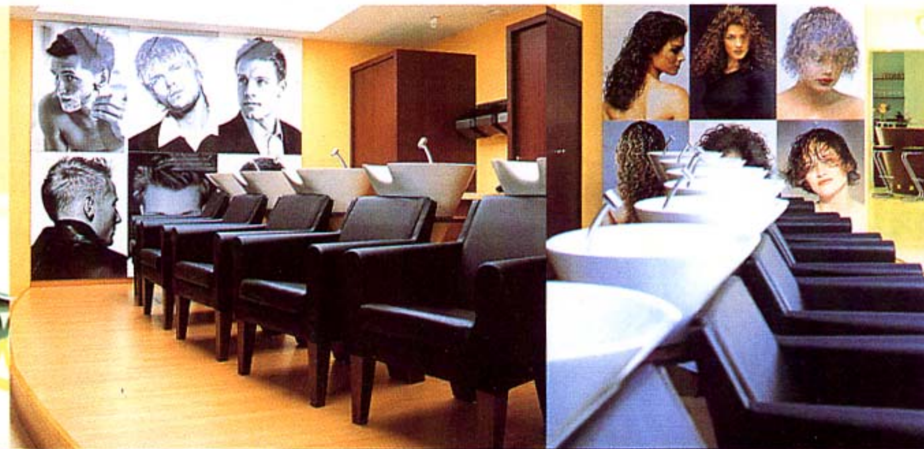
De multiples espaces