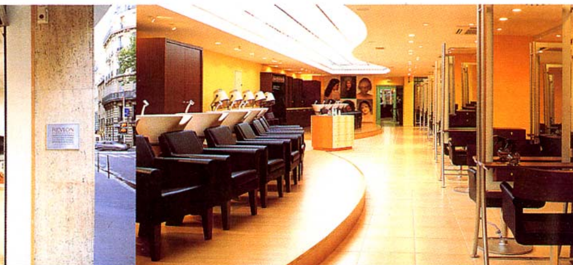
Les courbes et l'harmonie Feng Shui