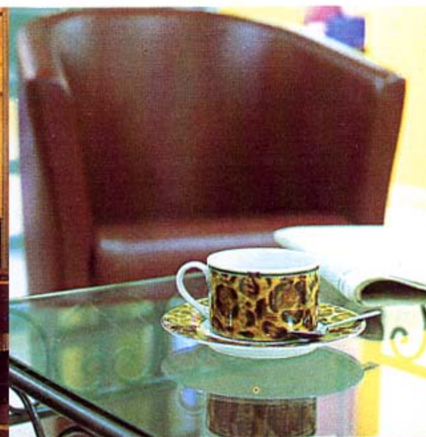
Un mobilier spécifique