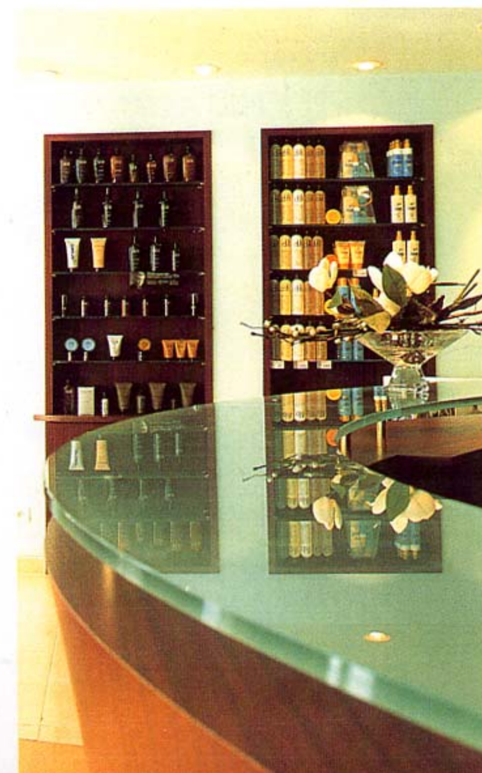
L'exposition des produits