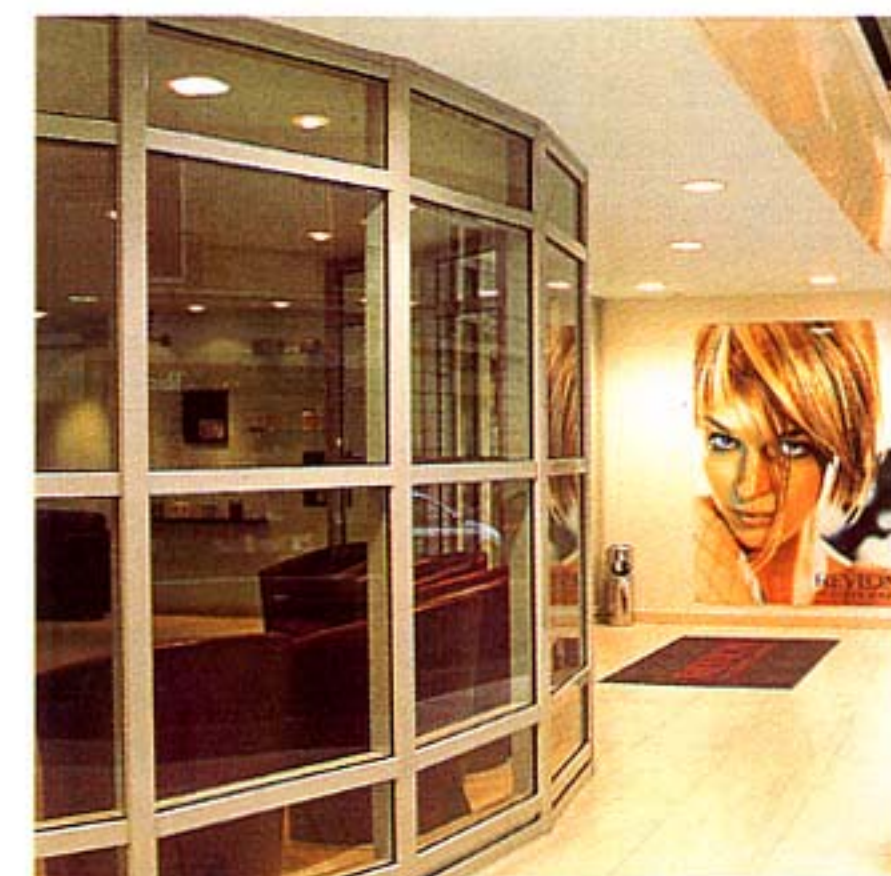
Une belle vitrine dans Paris