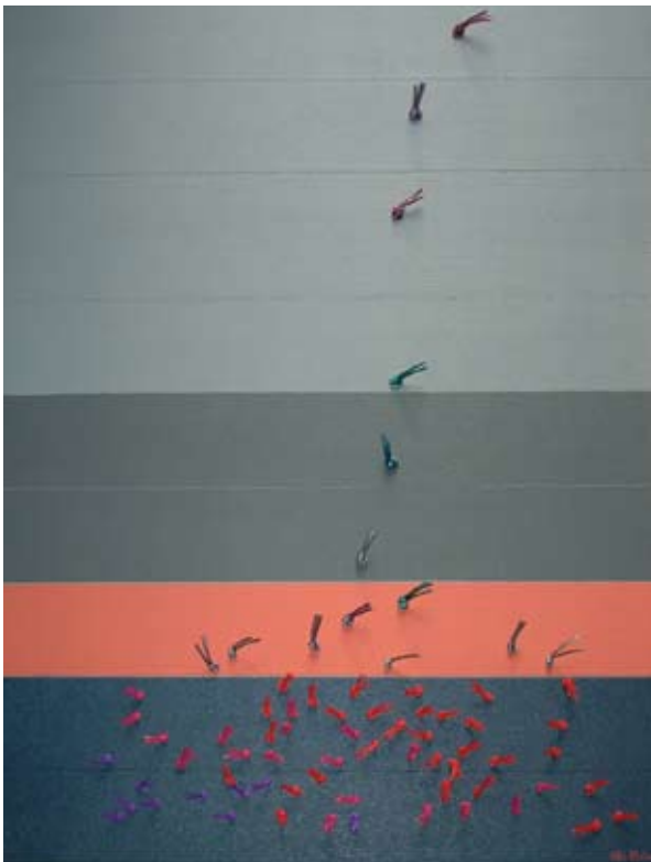
De la Boue et de la Rosée (140x100) 2011